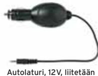
Aulolaturi, 12V, liitetään radiopuhelimeen tai pöytälaturiin/Billaddare, 12V, ansluts till radio eller laddfack. Tuotenro/Art.nr: 4252