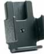
Pidin/Hällare. Tuotenro/Art.nr: 2219