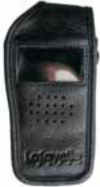
Nahkalaukku./Läderväska. Tuotenro/Art.nr: 2103