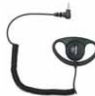
Ulkoinen korvanappi/ Yttre öronmussla