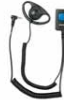
Miniheadset, joka sisältää ulkoisen korvanapin, erillisen lähetyispainikkeen ja mikrofonin pidikkeineen/Miniheadset med yttre öronmussla, separat sändartangent och mikrofon samt klips. Tuotenro/Art. nr: 2521