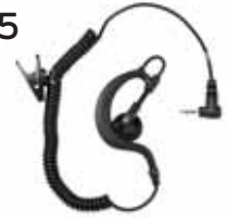
Sisäinen korvanappi/Inre öronmussla. Lyhyt kaapeli/Kort kabel Tuotenro/Art. nr: 2502 Pitkä kaapeli/Lång kabel Tuotenro/Art.nr: 2512