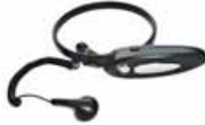
Kurkkumikrofoni/Bluetooth, toimii adapterin BTA-80 kanssa Strupmikrofon/blåtand fungerar ihop med BTA-80 Tuotenro/Art. nr: 2812