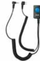
Kuulonsuojaimen asennettava miniheadset/Miniheadset till hörselkäpa. Peltor. Tuotenro/Art.nr: 2523 Sordin. Tuotenro/Art.nr: 2524