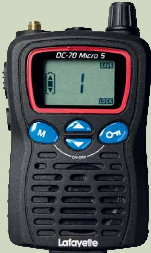
Luonnollinen koko/Naturlig storlek