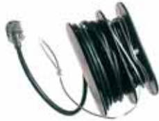
Heittoantenni, antaa parhaan kantaman (2/3-kertaisen)/ Kastantenn, ger bästa räckvidd (2-3gr). 31MHz, Tuotenro/Art.nr: 3067 155MHz, Tuotenro/Art.nr: 3068