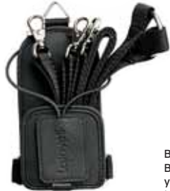
Vyökotelo, helpokäyttöinen ja käytännöllinen/Bärsele, enkel och praktiskt använda. Tuotenro/Art.nr: 2104