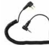
Kuulonsuojaimen radiokaapeli/Radiokabel till hörselkäpa. Peltor. Tuotenro/Art.nr: 2503 Sordin. Tuotenro/Art.nr: 2504