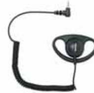
Ulkoisen korvanappi/Yttre öronmussla. Lyhyt kaapeli/Kort kabel Tuotenro/Art.nr: 2501 Pitkä kaapeli/Lång kabel Tuotenro/Art.nr: 2511